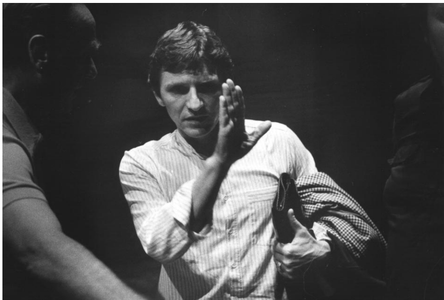
Gradimir Pankov directeur artistique au National Ballet of Finland, 1981

Cullberg, qu'il dirigera sporadiquement. Il amorce initialement sa carrière de chorégraphe en revisitant de manière contemporaine de grands ballets classiques avant de produire ses propres créations.