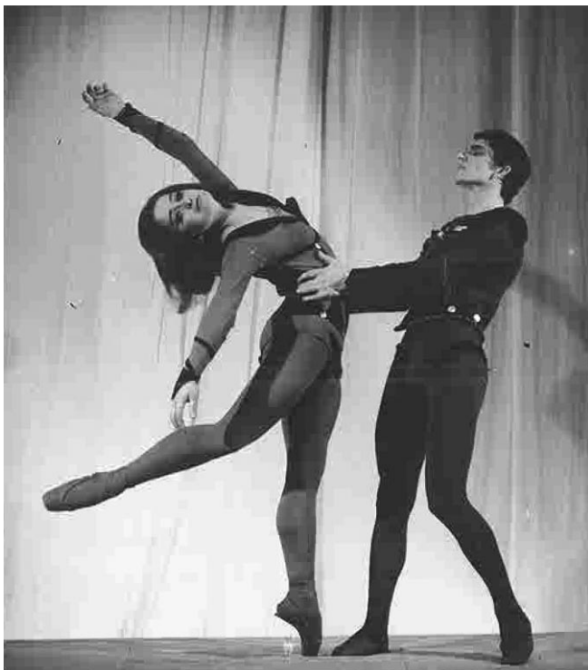
Le Combat de Tancredi et de Clorinde, 1965

Après un service militaire obligatoire d'un an, il revient à Skopje au moment du tremblement de terre qui terrasse la ville en juillet 1963. Le théâtre est détruit sans espoir de reconstruction prochaine malgré les fonds internationaux, l'obligeant à partir ailleurs. Il danse d'abord à titre d'artiste invité pour diverses compagnies de ballet yougoslaves. À Belgrade il admire la danse de Martha Graham. Puis il sort du territoire yougoslave, épousant sa fiancée danseuse pour pouvoir l'emmener avec lui, danse de l'Égypte à la France, de la