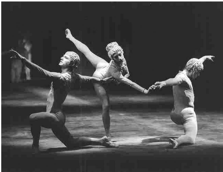
Orphée et Eurydice, 1972

aller à danser trop longtemps, c'est une leçon qu'il appliquera à lui-même, le moment venu, et à laquelle il estime que chaque danseur doit savoir réfléchir, tout comme il pense qu'un danseur, au-delà de sa technique, est avant tout l'expression de sa personnalité et doit choisir ses rôles en adéquation.