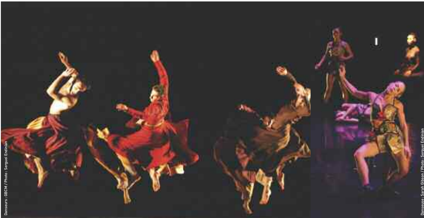
Danseurs : GBCM