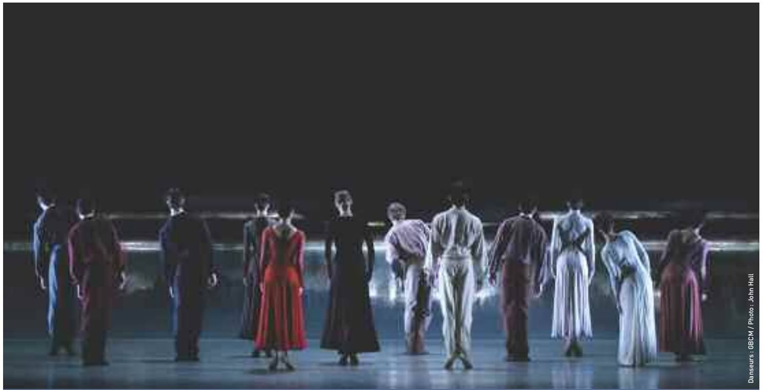
Danseurs : GBCM