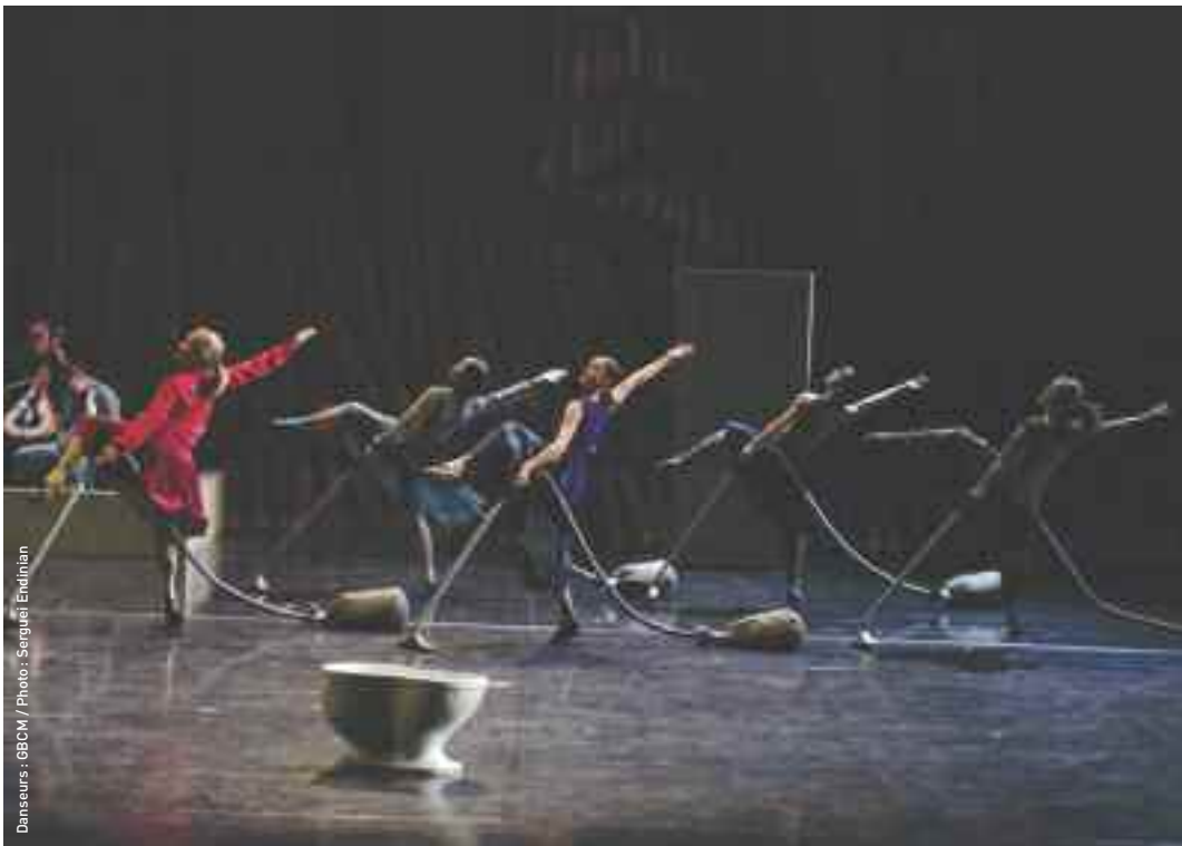
Danseurs : GBCM