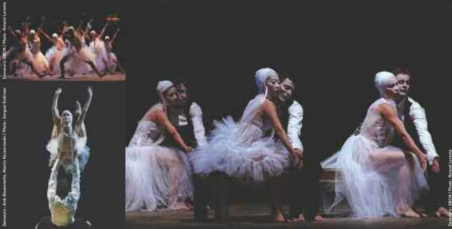
Danseurs : GBCCM / Photo : Roland Lorente