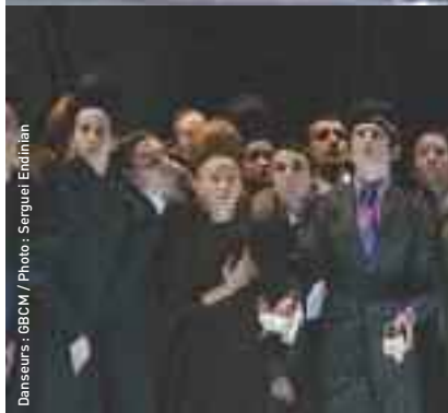
Danseurs : GBCM