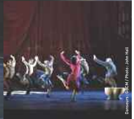
Danseurs : GBCM / Photo : John Hall