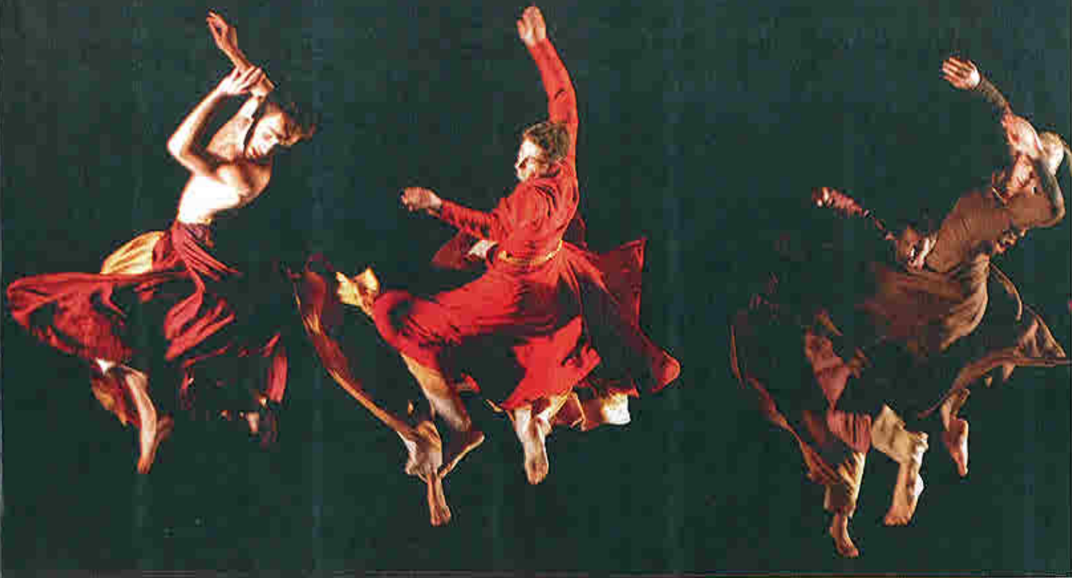
Les Grands Ballets canadiens dans Arbos d'Ohad Naharin.