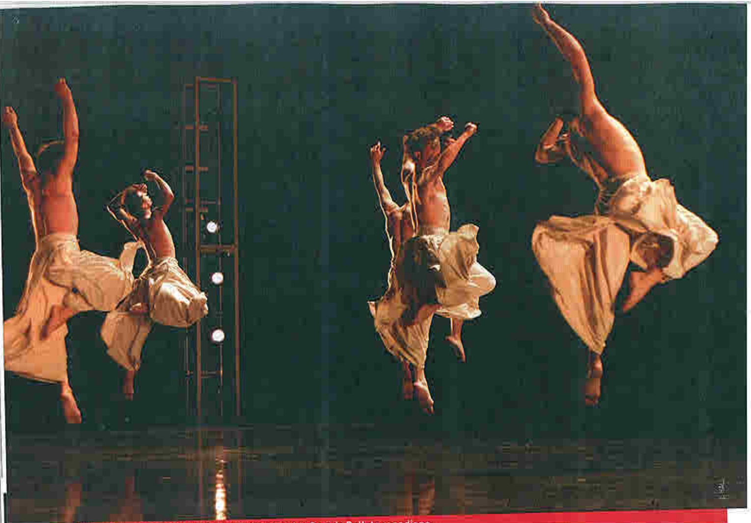
Minus One, pièce d'Ohad Naharin créée pour les Grands Ballets canadiens.