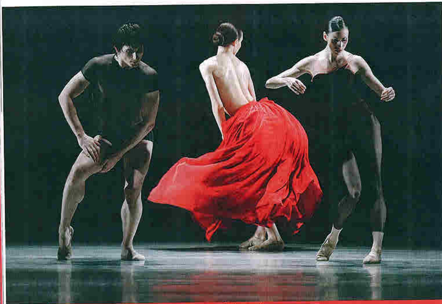
Bella Figura de Jiri Kylian, dans l'interprétation des Grands Ballets canadiens.

tiel inhabituel. Il est un peu mélancolique, romantique, et j'aime beaucoup ça. Ses pièces ont quelque chose de naïf mais de très plaisant. Elles sont traversées d'une atmosphère de clownerie désabusée, de désir, avec des pas de deux très tristes... Stijn Celis est un puissant du mouvement, presque dur, d'une matière brute, au fond très australien. Avec Cindirella , il a sorti une œuvre insolite où l'on navigue dans un monde étrange de découvertes, avec des ruptures d'où surgit le non-sens. Ce n'est plus Cendrillon, mais une métaphore de la mémoire. Les deux viennent du classique, ont été des danseurs de contemporain exceptionnels et sont vraiment originaux. Mais tout cela ne m'empêche pas de programmer du Balanchine, parce que ça fait du bien à la compagnie au niveau de la technique, de la virtuosité, ou Casse-Noisette une fois par an, à Noël. Le public adore, et les danseurs ont le plaisir de se replonger dans la technique la plus académique qui soit. ♦