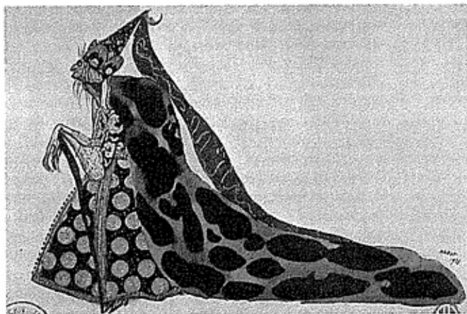
LA BELLE AU BOIS DORMANT. Costume pour la fée Carabosse, maquette de Léon Bakst pour la Belle au bois dormant de Nicolas Sergueïev et Bronislava Nijinska, 1921. Paris, bibliothèque-musée de l'Opéra.

■ N. Sergueïev (d'après M. Petipa) et B. *Nijinska. THE SLEEPING PRINCESS. Ballet en 3 actes. MUS. Tchaïkovski et I. *Stravinski, DÉC. et COST. L. *Bakst. CRÉAT. le 2 nov. 1921 à l'Alhambra Theatre, Londres, par les *B. russes, avec O. *Spessivtseva (Aurore), P. *Vladimirov (le Prince), C. *Brianza (la fée Carabosse).